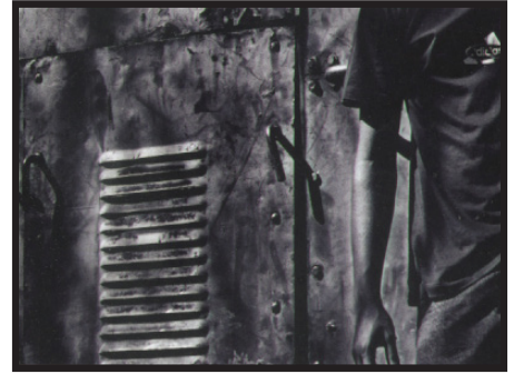
විහාරමහාදේවී තරගයේ සහ ශ්‍රී ලංකන් ෆෝටෝ ලවර්ස් ඔන්ද ස්පෝට් තරගයේ ප්‍රථම ස්ථානය දිනූ විරාජ් ලියනාරච්චිගේ (5118) ඡායාරූපය