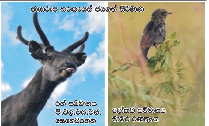
ඡායාරූප තරගයෙන් ජයගත් නිර්මාණ