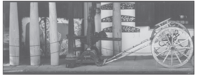
වර්ණ : 1 වන ස්ථානය - එම්. ඒ. ඉඳුනිල් ජීවන්ත