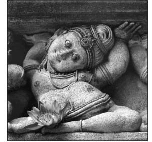
අමීල බටගල්ල (වර්ණ ප්‍රථම ස්ථානය)