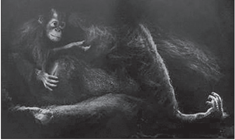
ඕෂධ වම්ල (විල්සන් හෑගොඩ ශූරතාව)

විල්සන් හෑගොඩ ශූරතාව සඳහා වන සත්වෝද්‍යාන චාරිකා ඡායාරූප තරගය 2015 සැප්තැම්බර් මාසික තරගය ලෙස පවත්වන ලදී. එහි ඡයග්‍රාහක නාමලේඛනය, කෘති තේරීම සහ විචාරයට දායක වූ දෙටු සාමාජික පිරිස පහත සඳහන් ය.