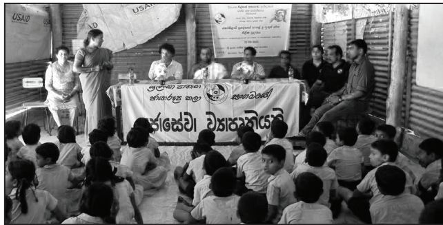
(2015 මුලතිව් සමාජ සන්නිවේදන ව්‍යාපෘතිය)

පන්ති පැවැත්වෙන දිනයන්හි දී මහාබෝධි විදුහලේදී ද, පහත සඳහන් ස්ථානයන්ට ද ඉහත ද්‍රව්‍ය භාරදිය හැකි අතර මුදල් ආධාර ලංකා බැංකුව, බම්බලපිටිය ශාඛාවේ අංක 717752 දරන ගිණුමට ද බැර කළ හැකිය.